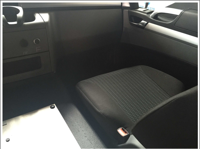
Bedienung der Sondersignalanlage vom Beifahrer