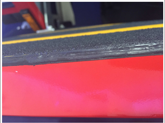
Korrosionsbeständige Oberfläche (GFK)