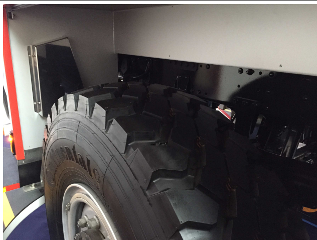
Sichere Verkleidung der Hebetchnik