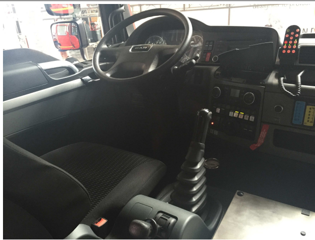
Bedienung der Sondersignalanlage vom Fahrer