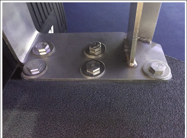
Sichere Befestigung der Auftritte